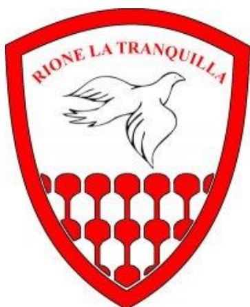
CONTRADA DELLA TRANQUILLA